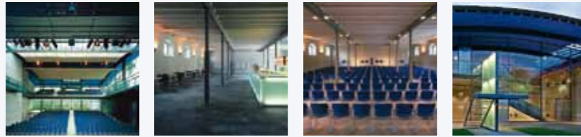
A Stadtsaal B Altes Foyer C Säulensaal D Neues Foyer

Die Übersicht zeigt Ihnen, wo Sie welche Aussteller finden, wie Sie zu den Vortragsorten kommen und wo sich die Catering-Bereiche befinden.